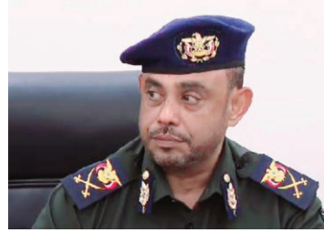
بل الآلاف من الضباط المستحقين للترقيات إلى هذه الرتبة .

في المصلحة تم ترقبته إلى رتبة عميد من قبل الرئيس السابق عبدربه منصور هادي ومن ثم تعيينه وكيلا للمصلحة .