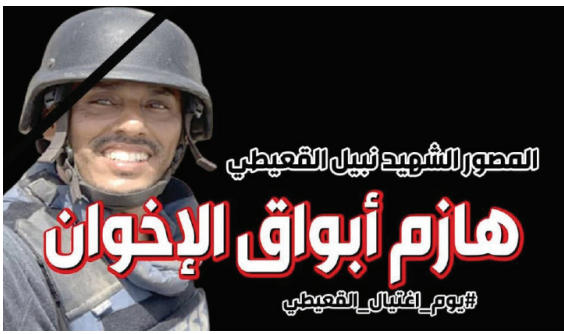
المصور الشهيد نبيل القسبي

امسح الكود بجوالك وتابعنا على موقعنا الإلكتروني