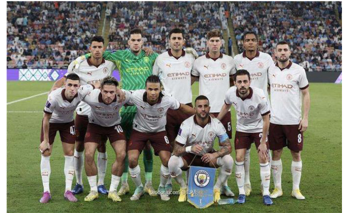
الأمناء / متابعات:

وتمثل 7tickets، نقلة نوعية كبيرة في عالم السياحة الرياضية، لما تقدمه من خدمات لحجز تذاكر المباريات حول العالم لحضور مثل هذه الأحداث والاستمتاع بها.