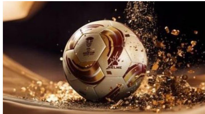
الأمناء / متابعات:

أعلن الاتحاد الآسيوي لكرة القدم، عبر حساباته على مواقع التواصل الاجتماعي عن الكرة الرسمية التي ستلعب بها المباراة النهائية لبطولة كأس آسيا المقررة في قطر.