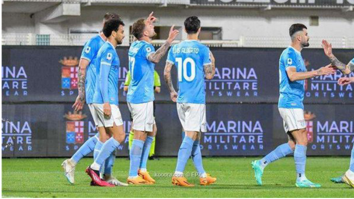
الأمناء / متابعات:

كشف تقرير صحفي عن رغبة أحد الأندية السعودية في التعاقد مع نجم من نخبة المهاجمين بالكرة الإيطالية، خلال الانتقالات الصيفية، بنهاية الموسم الجاري.