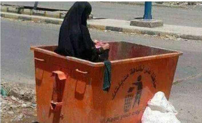
الأمناء / متابعات / فضل عبد الله الحبشي

هي واحدة من مئات نابشي القمامة صغاراً وكباراً ومن ليس له سند ولا معين، يتجولون في شوارع مدينة عدن وأزقتها في رحلات يومية متكررة بحثاً عن مورد رزق مصدره حاويات القمامة. هذه المرأة لا تجد غضاضة ولا عيباً في أن يكون مصدر لقمة عيشها وأسررتها من مخلفات الغير، وهو عمل تدرك أنه يقهها ذل السؤال ومد اليد إلى الناس، أعطوها أو منعوها. جمع نفايات قابلة للبيع من مطارح الحاويات عمل خطير وشاق، لكن الظروف والأوضاع الاقتصادية أجبرتها هي وأمثالها على اختيار ذلك كمهنة.