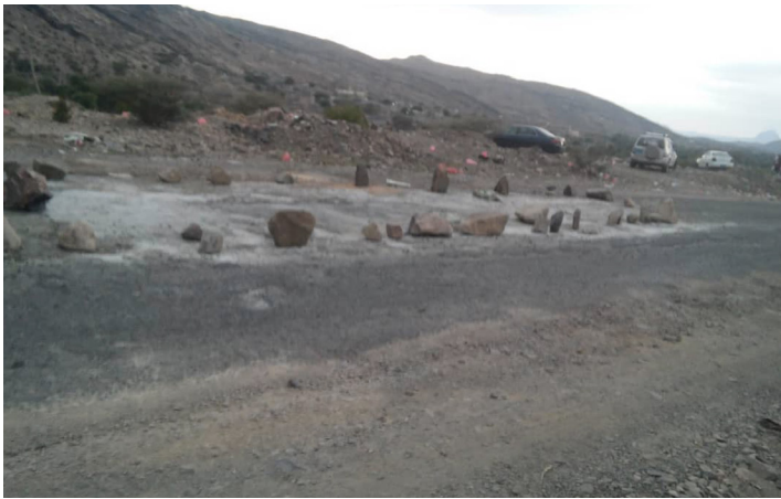
ردفان / الأمناء / حسين البكري:

قام مواطنون بردفان بمحافظة لحج يوم أمس الأول بترميم الطريق الرئيسي الرابط بين مدينة الحبيلين وحبيل جبر بمنطقة الربوة العليا. وجاءت مبادرة الأهالي للطريق بعد تعرضها للتشقق والتدمير وازدياد الحوادث المرورية على هذا الطريق الحيوي الهام. وقال مواطنون من أهالي منطقة الربوة: «هناك الكثير من الحفر وسط الطريق تم ترميمها من قبل المواطنين ومنها ترميم في نقيط تيم بالشهر الماضي وعمل الصيحات والترميمات اللازمة». وأضافوا بأن الطريق تشهد حركة سير بكثرة بعد قطع الطرقات من قبل المليشيات الحوثية في بعض المناطق غرب الضالع، كما وتعتبر الطريق الرابطة بين حبيل جبر والحبيلين الطريق الوحيدة الذي يربط بين عدن وصنعاء.